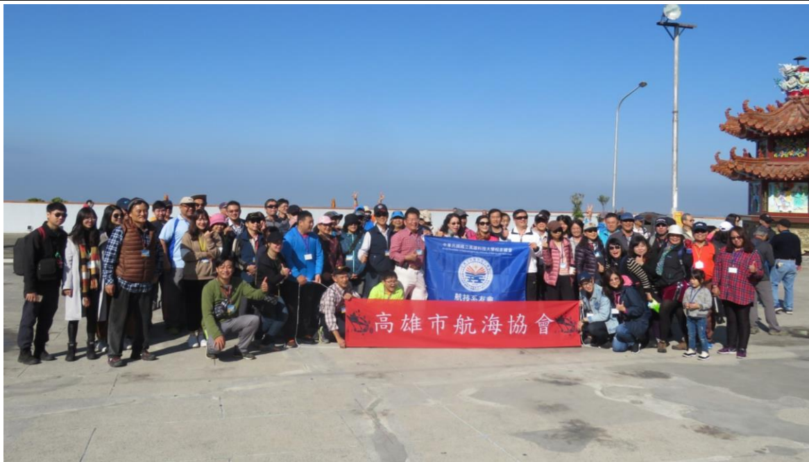
大崗山超峯寺廟前廣場大合照